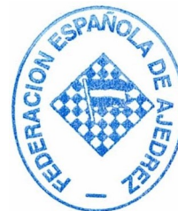
Javier Ochoa de Echagüen Estibález Presidente de la Federación Española de Ajedrez